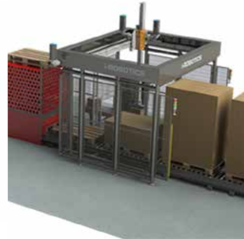
Final de línea